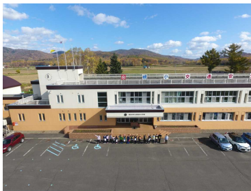
R3森林教室でのドローンより