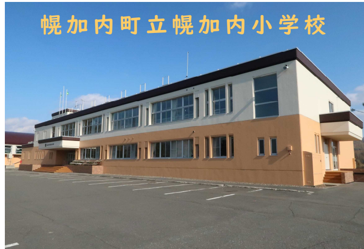
R4現在の幌加内小学校校舎