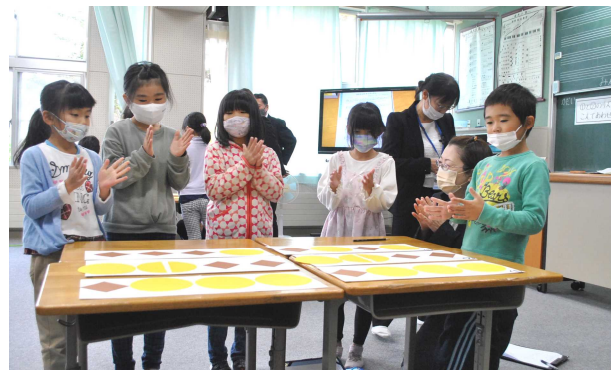
1年生 音楽 グループ活動