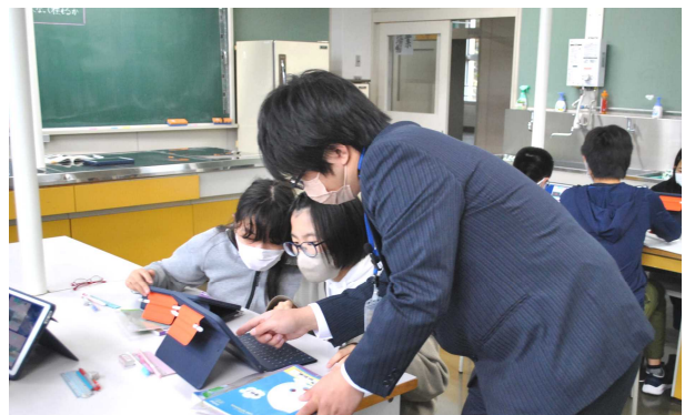
6年生 理科 実験結果の考察