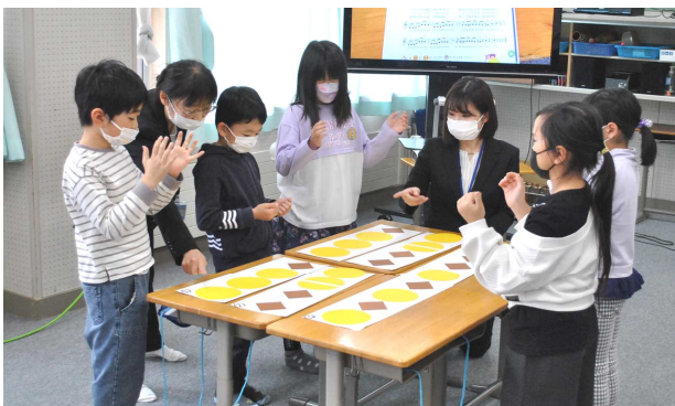
2年生 音楽 グループ活動